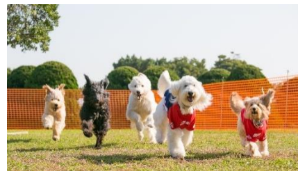
ドッグランイメージ