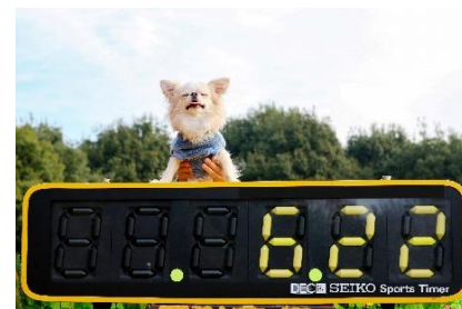
タイムレースイメージ