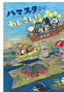
『ハマスタまでわんさんぽ』キービジュアル

今回、本イベント開催を機に、横浜スタジアムまでの道のりを愛犬と一緒に楽しくお散歩できる、お散歩 MAP が登場！さらに、本イベントのサテライト会場として、横浜公園では愛犬と撮影できるフォトスポットやキッチンカーも登場予定の『ハマスタまでわんさんぽ』（主催：DeNA）を開催します。