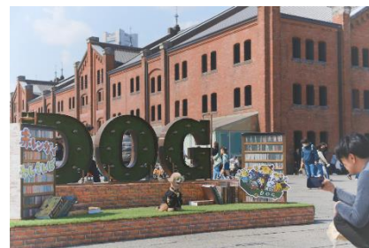
フォトスポットイメージ

会場内にはワンちゃんが可愛く映えるフォトスポットを多数ご用意。DOGの文字をかたどったオブジェや、イベントキービジュアルをモチーフにした装飾など、つつい愛犬の可愛い姿を撮りたくなる空間を演出します。