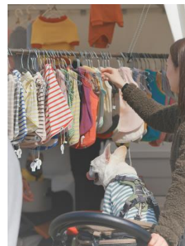
マーケットイメージ

また、キッチンカーでは、鯖料理やタイ料理、コーヒーやデザートなど様々なグルメをお楽しみいただけます。