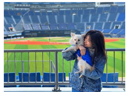
「DREAM GATE STAND」での撮影イメージ