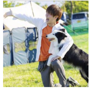
ドッグダンス イメージ