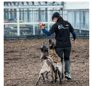
災害救助犬のデモンストレーションイメージ