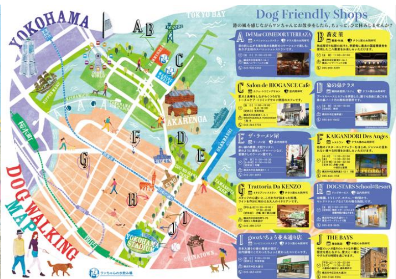
(上段) お散歩 MAP (下段) コンテンツ一例