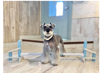
ミニアジリティ イメージ