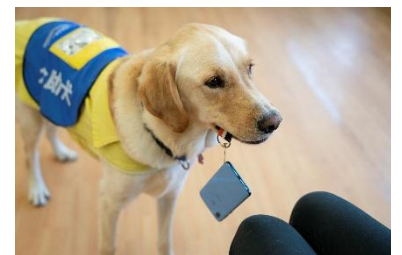
介助犬のデモンストレーション イメージ