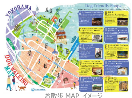
お散歩 MAP イメージ

ハマスタまでの道のりを愛犬と一緒に楽しくお散歩できる、お散歩 MAP が登場！MAP では、愛犬とのお散歩途中に楽しめる店舗や施設など、定番から穴場のスポットまでご紹介します。新たな発見をしながら、愛犬とのお散歩をもっと楽しく、充実した時間をお過ごしいただけます。