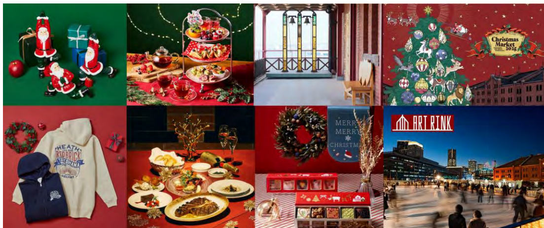
<横浜赤レンガ倉庫 クリスマスグルメ・グッズ・スポット・イベントイメージ>

横浜赤レンガ倉庫では、1号館・2号館のレストラン・カフェ・フードコート・物販各店にて、クリスマスにぴったりの季節感あふれるスイーツやグルメ、グッズが登場いたします。ここでしか手に入らない“横浜赤レンガ倉庫限定”の特別アイテムや特別メニューのほか、大切な人と過ごすかけがえのないひとときを彩る、クリスマスシーズン限定のコースメニューやオリジナルアイテム作り体験、デートにぴったりのフォトスポットなどもあわせてご紹介いたします。