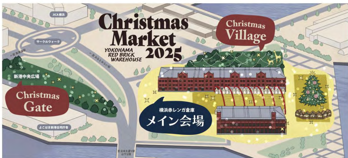
『Christmas Market in 横浜赤レンガ倉庫』エリアマップ