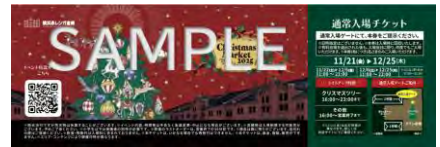
通常入場チケットイメージ