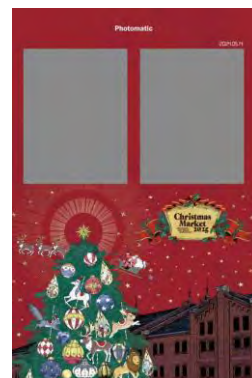
クリスマス限定フレーム イメージ