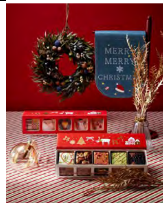
クリスマス限定パッケージ イメージ