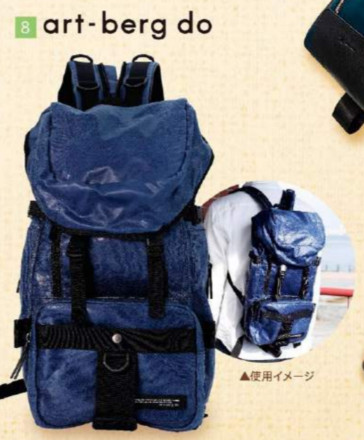
8 art-berg do ▲使用イメージ