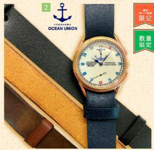
2 YOKOHAMA OCEAN UNION 数量限定