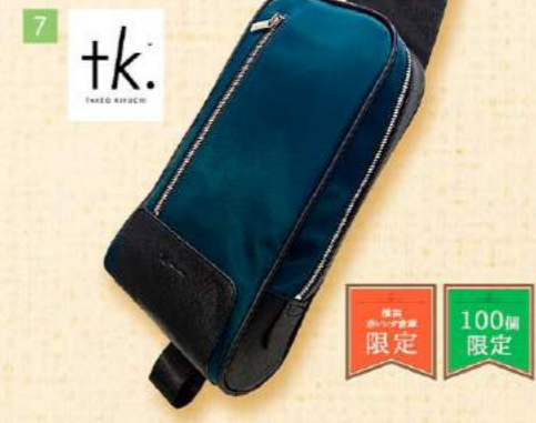
7 tk. 数量限定 100個限定