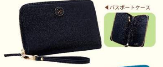
パスポートケース