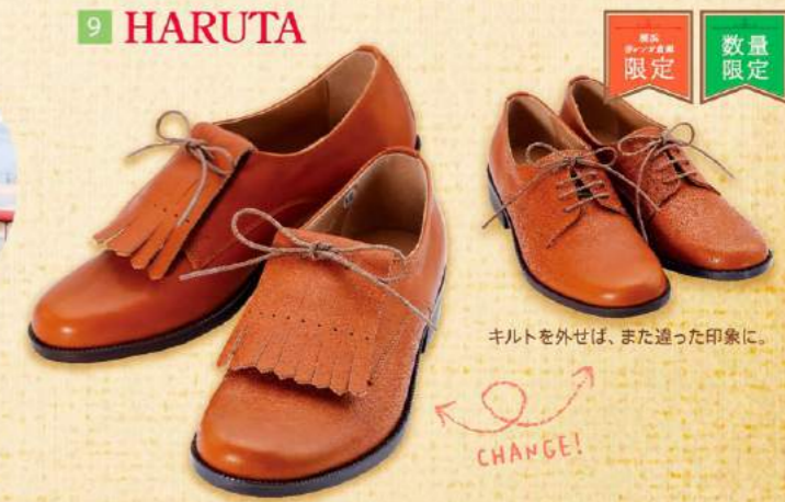
9 HARUTA 数量限定 キルトを外せば、また違った印象に。 CHANGE!

1 肉厚で肌なじみの良いフィンランド産エルク革を使用。春のファッションにピッタリな3色展開です。〈GRANDER PLUS〉エルクレザーバンドウォッチ 各¥21,060(税込)【2号館-1F/エスダブリュシー】 2 オーシャンユニオン16周年を記念した手造り腕時計!同じく16周年を迎える赤レンガ倉庫。記念になる1本です。16thオーシャンユニオン ハンドメイドウォッチ ¥19,440(税込)【2号館-2F/ヨコハマオーシャンユニオン】 3 お花モチーフやハワイアンデザインなど多数取り揃えております。全てハワイで製作されたジュエリーです。ハワイアンジュエリー ¥2,700(税込)~【2号館-2F/フリースタイル】 4 使い込む程深みが増すレザーベルト。豊富なカラーバリエーションとシンプルなデザインがどんな場面でも大活躍です。シンプルカラーベルト(全7色) 25mm ¥5,940(税込) 35mm ¥6,480(税込)【2号館-1F/ソットバイクオドロ】 5 春の代名詞、桜の木で出来たバスケース。定期券の他、電子マネーカードやカードキーにもご利用いただけます。IC-Pass Case 赤レンガ限定イラスト 各¥5,184(税込)【2号館-2F/ハコアダイレクトストア】 6 春といたらデニム!デニムといたらLee!! 待望のLeeとのコラボCAPが新登場★CAP好き集合!! LeeXoverride INITIAL CAP with POUCH 各¥5,292(税込)【2号館-1F/オーバーライド】 7 人気の赤レンガ限定シリーズに初めてのブルーが登場!春らしい爽やかな装いにぜひ!! 縦型ボディバッグ ¥8,532(税込)【2号館-2F/ティーケー タケオキクチ】 8 大容量バックバックにさわやかなブルーが登場!ワンショルダーとの2way使用で、お出かけからご旅行にピッタリ! A4サイズ 2wayバック ¥14,040(税込)【2号館-1F/アートバーグドゥ】 9 上質で柔らかい牛革のレースアップシューズ。気分に合わせて同素材のキルトを付けて出かけよう! キルト付きレースアップシューズ サイズ:22.5cm~24.5cm ¥13,824(税込)【2号館-2F/ハルタ】