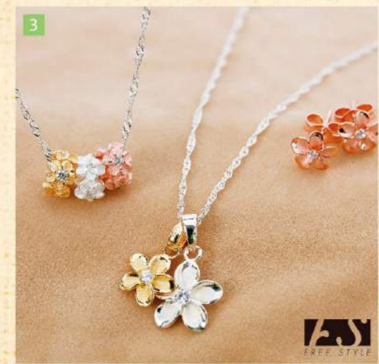
3 FREE STYLE