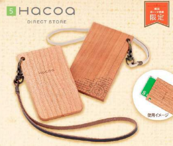
5 HACOIA DIRECT STORE 数量限定

【花名の由来】 その花が鈴のように見えることから「鈴蘭(スズラン)」と呼ばれています。ヨーロッパでは5月の花として愛されています。