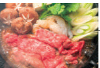
常陸牛すき焼き鍋 (ミニサイズ) 大人気の常陸牛すき焼き鍋をお手頃なミニサイズで。※卵はついていません。