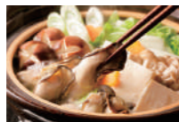
牡蠣の土手鍋 (ミニサイズ) 鍋の周りに味噌を塗りつけ、カキと豆腐や野菜を煮ながら食べる広島県の郷土料理。