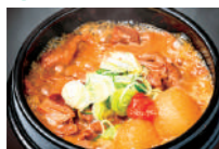
1日600杯売れる 香味味噌の柔らかもつ煮込み (ミニサイズ) もつが苦手な方も慮にする。柔らかく濃厚、臭みゼロ。横浜発祥の味わいをご堪能下さい。