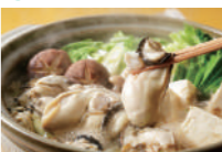
あご出汁牡蠣海老の海鮮鍋 (ミニサイズ) あご出汁と自家製出汁を合わせたスープに海鮮の魚介がマッチした逸品。