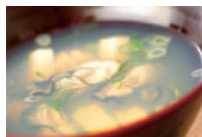
牡蠣汁 (ミニサイズ) 牡蠣が1つ入ったミニ鍋。