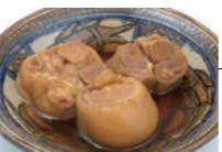
島おでん (ミニサイズ) 沖縄のおでんの特徴である、てびち(豚足)入りの島おでん。