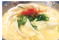
博多・炊き餃子 (ミニサイズ) もちもち食感の皮で包んだ餃子を、豚骨ベースの特製スープで旨味が出るまでじっくり炊いた、博多の新名物。