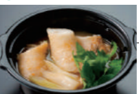
きりたんぼ鍋 (ミニサイズ) 本場! 大盛りたんぼ鍋を通常の1/3サイズでご提供! 比内地鶏のガラスープが自慢!