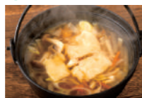
ひつすみ鍋 (ミニサイズ) 「ひつすみ」は小麦粉をこねて薄くのばしたものを、手でちぎり野菜と一緒に煮込んだ鍋料理で、岩手県の郷土料理です。