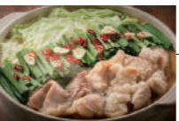
博多もつ鍋 (ミニサイズ) 博多名物! こだわりの牛もつを使用し、あっさりとした醤油ベースと甘い季節野菜で煮込んだ至福の一品です。