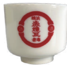
(オリジナルお猪口)