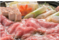
子牛鍋セット (ミニサイズ) 味噌仕立てでしっかりと味の牛鍋は、日本酒との相性抜群です!!