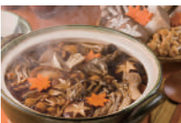
霜降りひらたけ鍋 (ミニサイズ) ホクトプレミアムきのこ「霜降りひらたけ」をきのこ出汁で煮込んだ「霜降りひらたけ鍋」。