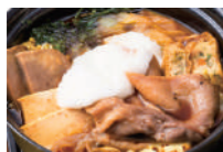
牛たんすきとろ鍋 (ミニサイズ) 特製のすきやきベースの割り下と牛たん&とろろの相性抜群です。他にはない自慢の一品です。