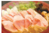
ココ旨味餃子 (ミニサイズ) 横浜育ち「はまほーく」使用。