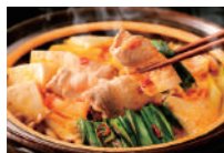
長野県産牛と白菜のぼかぼかキムチ鍋 (ミニサイズ) 長野県産のA5ランク黒毛和牛と白菜が入った心も体も温まる鍋です。