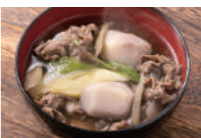
東北の風物詩 山形芋煮 (ミニサイズ) 山形といえば芋煮会! 家族や友人達と河原で鍋を囲んでおいしい芋煮を食べるのが山形の風物詩。