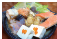
石狩あんこう鍋 (ミニサイズ) 鍋の横綱あんこうと北海道魚介たっぷりの石狩の魚介鍋の王様。