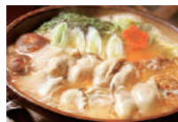
北海道知内町の牡蠣鍋 (ミニサイズ) 北海道知内町の新鮮牡蠣を使った牡蠣鍋のミニサイズ版。牡蠣鍋に合うこだわりの味噌で仕上げた旨味たっぷりの逸品です。