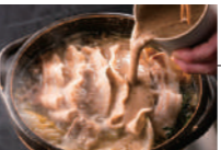
自然薯とろろ鍋 (ミニサイズ) 日本一映えない鍋! ちよい鍋でもとろろはたっぷり!!